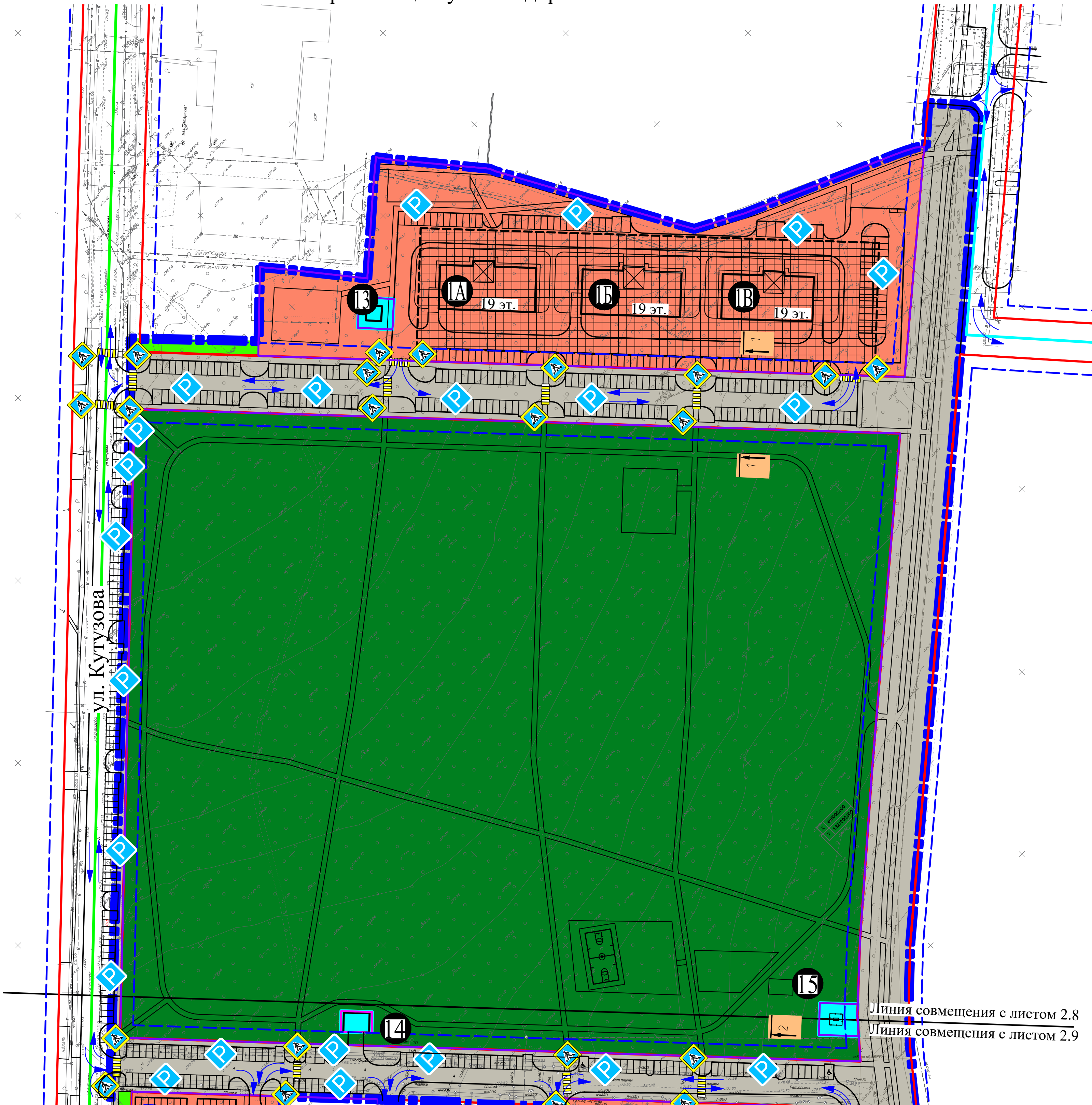
Расчет парковочных мест