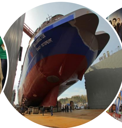
ВЫСТАВКА И КОНФЕРЕНЦИЯ «НЕВА»

ЭФФЕКТИВНАЯ КОММУНИКАЦИОННАЯ ПЛОЩАДКА ДЛЯ РАБОТОДАТЕЛЯ И СПЕЦИАЛИСТОВ 150 КОМПАНИЙ- РАБОТОДАТЕЛЕЙ 10 600 ПОСЕТИТЕЛЕЙ ( 2016 Г.)