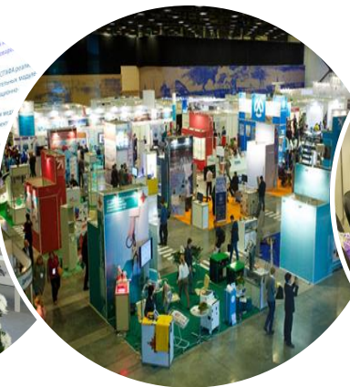
XXI МЕЖДУНАРОДНЫЙ ФОРУМ «РОССИЙСКИЙ ПРОМЫШЛЕННИК»

ДЕМОНСТРАЦИЯ ИННОВАЦИОННЫХ РАЗРАБОТОК, С ЦЕЛЬЮ ДАЛЬНЕЙШЕГО ВНЕДРЕНИЯ В ПРОИЗВОДСТВЕННЫЕ ПРОЦЕССЫ УЧАСТНИКОВ- 5 000 ПОСЕТИТЕЛЕЙ ( 2016 Г.)