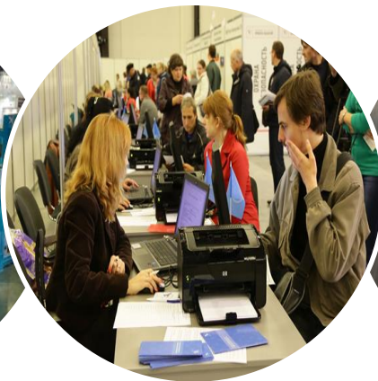
ЯРМАРКА ВАКАНСИЙ ПРОМЫШЛЕННЫХ ПРЕДПРИЯТИЙ

ПРАКТИЧЕСКОЕ ПРИМЕНЕНИЕ ИННОВАЦИОННЫХ ТЕХНОЛОГИЙ В СТРАТЕГИЧЕСКИХ ОТРАСЛЯХ ПРОМЫШЛЕННОСТИ УЧАСТНИКОВ- 283 КОМПАНИИ 6 000 ПОСЕТИТЕЛЕЙ ( 2016 Г.)