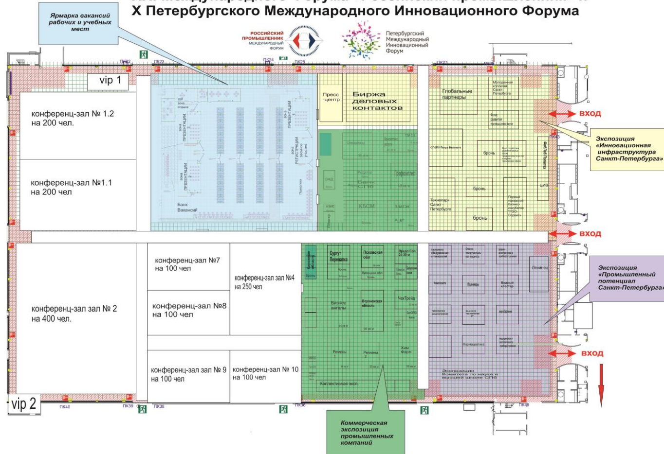
Схема-планировка выставочной экспозиции XXI Международного Форума «Российский промышленник» и X Петербургского Международного Инновационного Форума