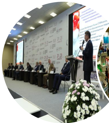
X ПЕТЕРБУРГСКИЙ МЕЖДУНАРОДНЫЙ ИННОВАЦИОННЫЙ ФОРУМ

ДЕМОНСТРАЦИЯ ИННОВАЦИОННЫХ РАЗРАБОТОК, С ЦЕЛЬЮ ДАЛЬНЕЙШЕГО ВНЕДРЕНИЯ В ПРОИЗВОДСТВЕННЫЕ ПРОЦЕССЫ УЧАСТНИКОВ- 5 000 ПОСЕТИТЕЛЕЙ ( 2016 Г.)