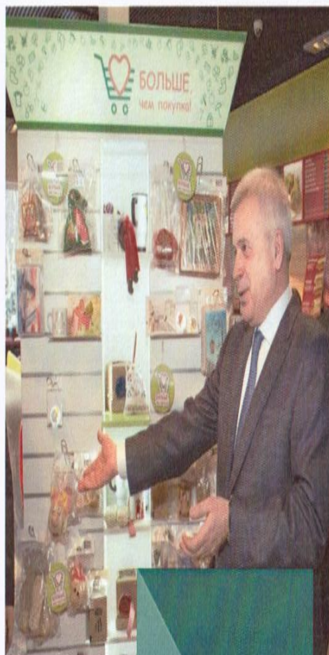
Вагит Алекперов, Учредитель Фонда «Наше Будущее»

Фонд «Наше будущее» — первая организация, системно развивающая социальное предпринимательство в России.